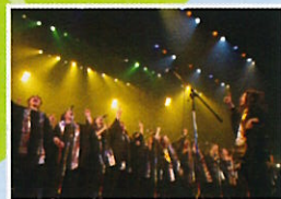
BROWN BLESSED VOICE